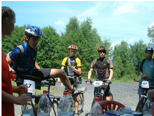
letošní příprava na noční etapu

...a to byl začátek bojů v Ruské ruletě - rok 2003 (ještě ne v Ptýrově )